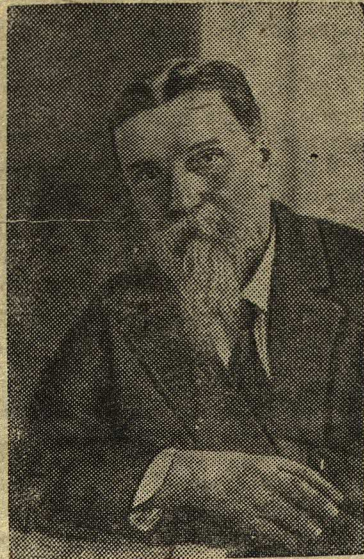
К. А. ТИМИРЯЗЕВ

Блуждая деятельность Тимирязева не находила должного отклика в доореволюционное время. Тогда еще не настало время для проведения в жизнь того, о чем мечтал Тимирязев. Только советская власть создала для этого необходимые условия. В